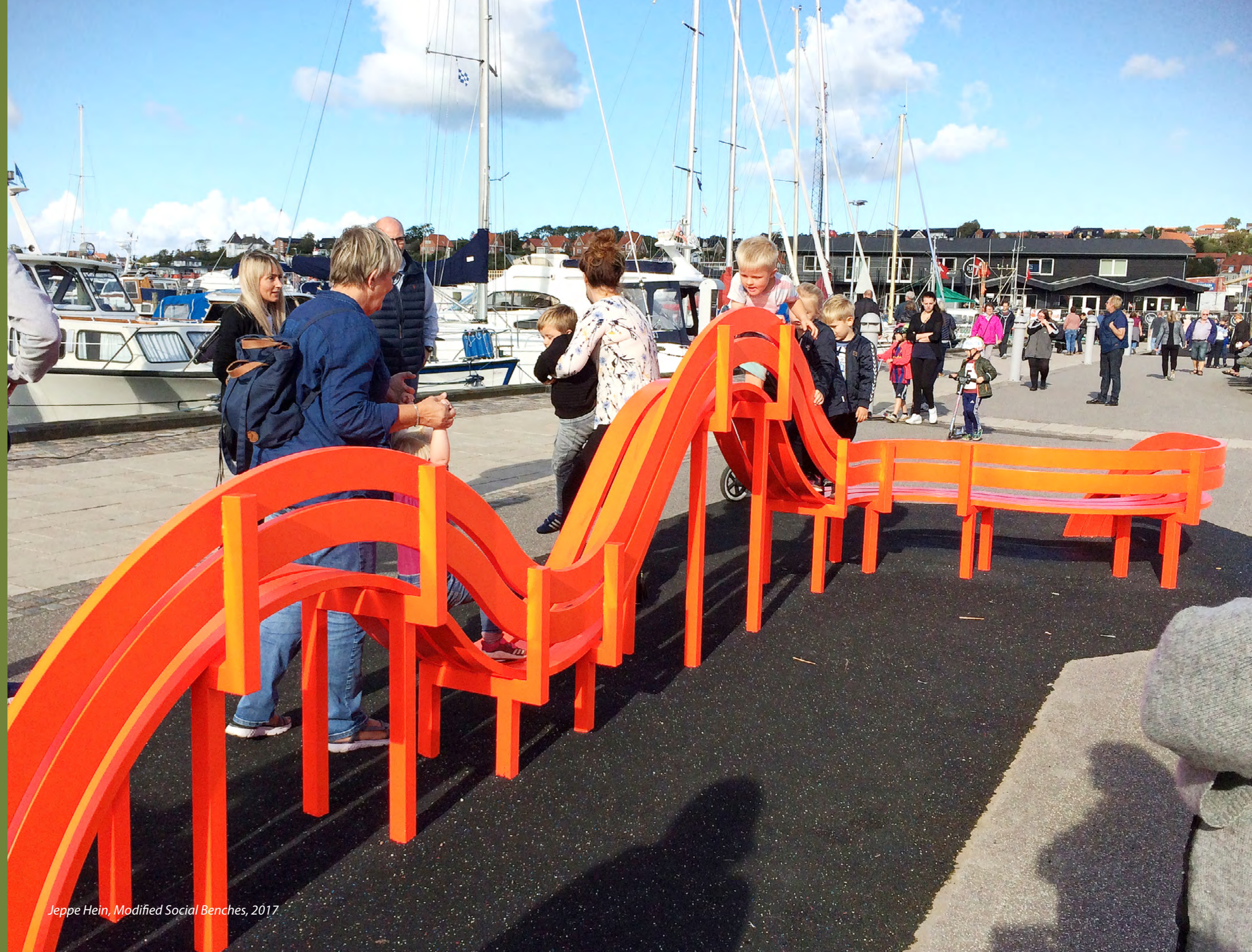
Jeppe Hein, Modified Social Benches, 2017

Det skal desuden sikres, at vores kunstinitiativer afspejler samtidskunstens spændvidde – fra klassiske genrer som maleri, skulptur og installation til mere eksperimenterende formater som lyd-, lys-, mediekunst og performance, samt deltagerbaserede workshops og events.