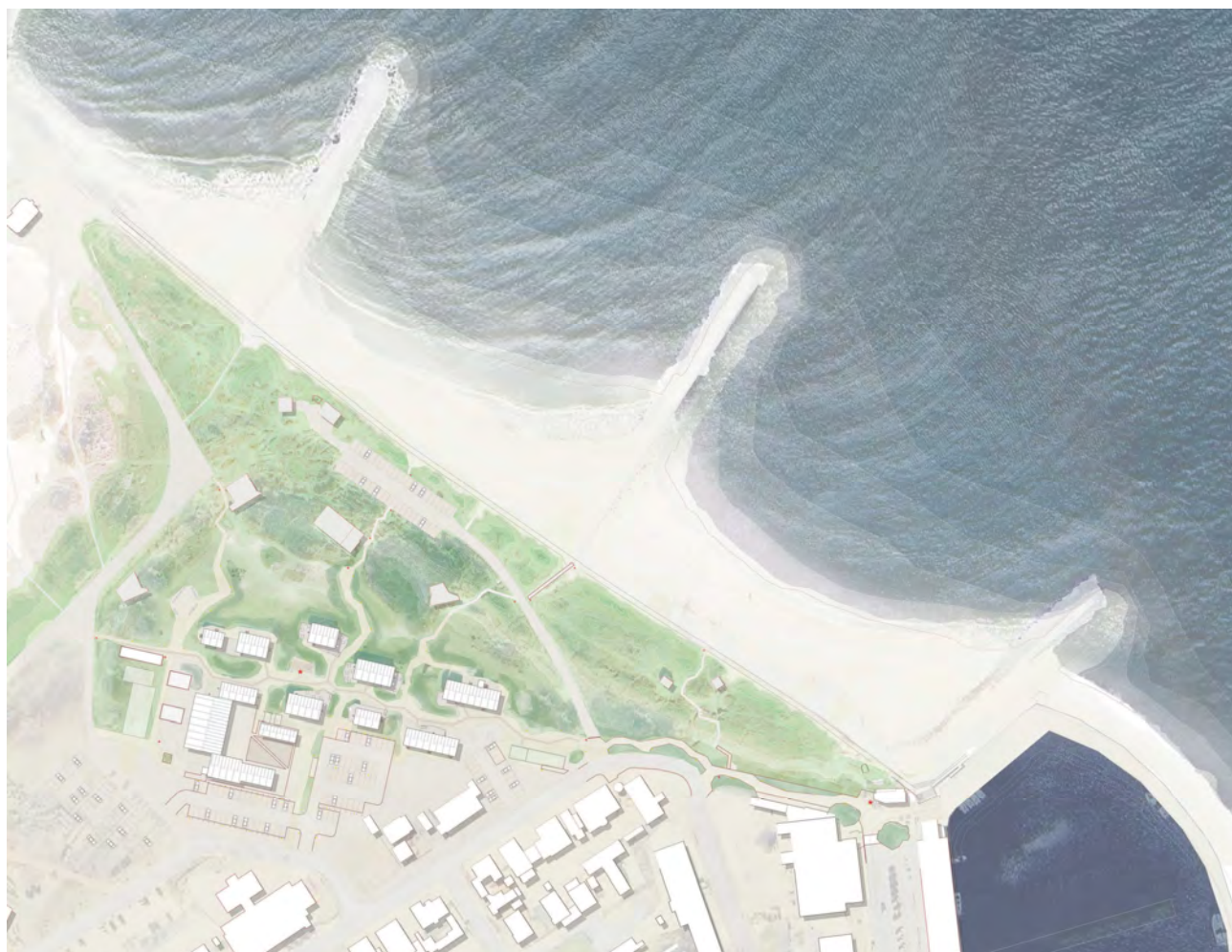
Plan, der viser etape 1 med stier og beplantning – illustration: SLA