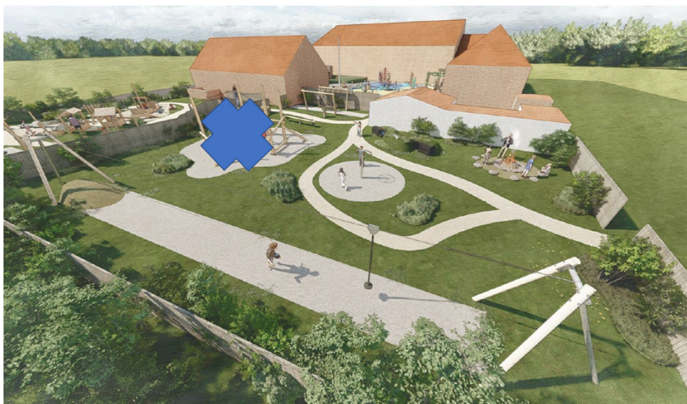
Den grønne skolegård ( det blå kryds dækker over et legeredskab som ikke bliver opført)

mange områder og børnehavens areal og skaber let tilgængelig adgang for alle arealer.