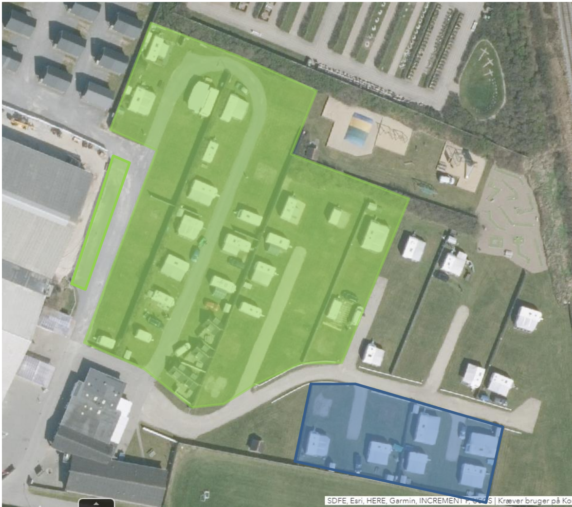
Figur 2: Areal til vintercampering (grøn markering) og vinteropbevaring (blå markering) på den eksisterende plads.