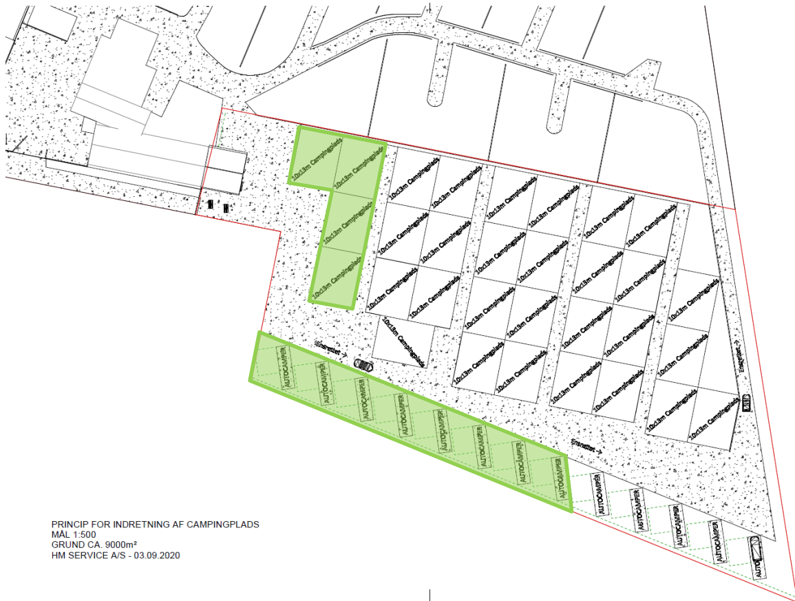
Figur 3: Princip for indretning af udvidelse. Med grøn markering af vintercampering på den nye del af campingpladsen.