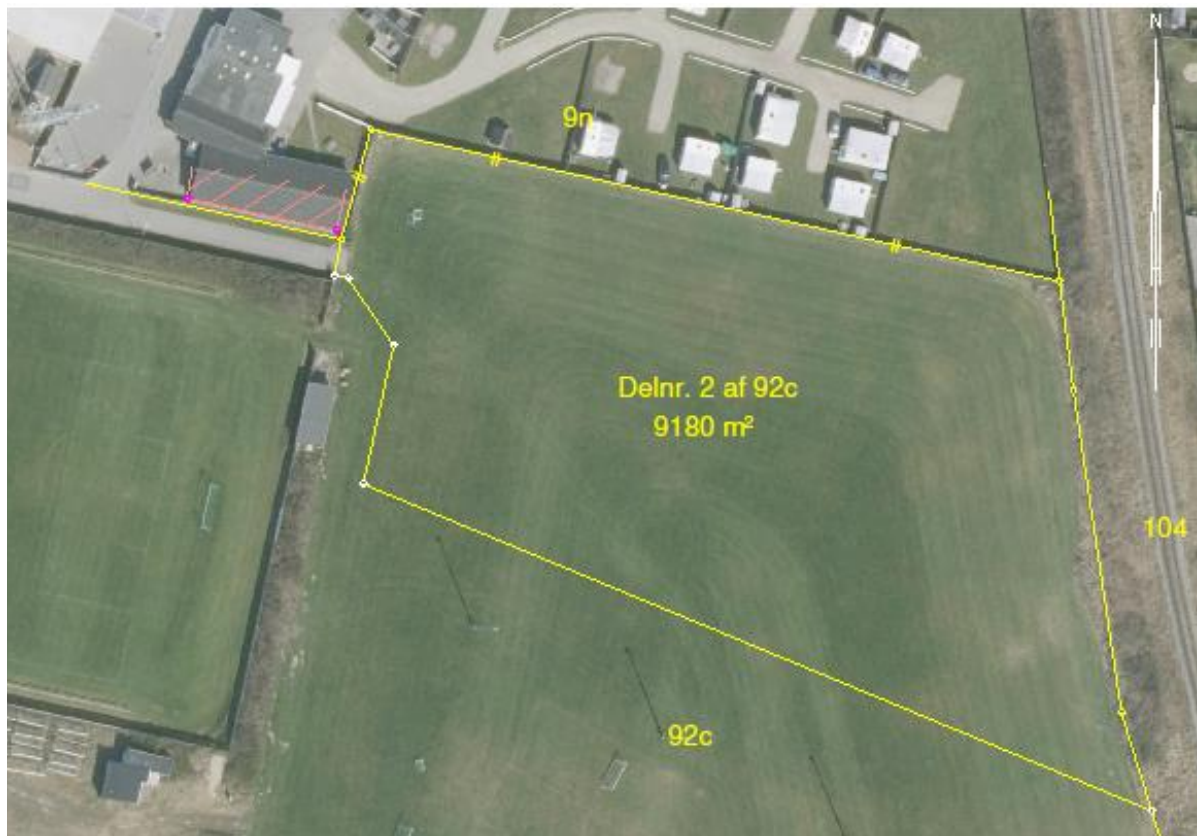
Figur 1: Campingpladsen udvides med dette areal